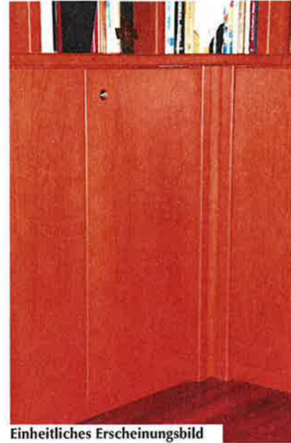
Einheitliches Erscheinungsbild mit hochwertigem Kirschbaumfurnier sowie durchgehender, einheitlicher Bildabwicklung in allen Wohnräumen, hier im Wohnzimmer...