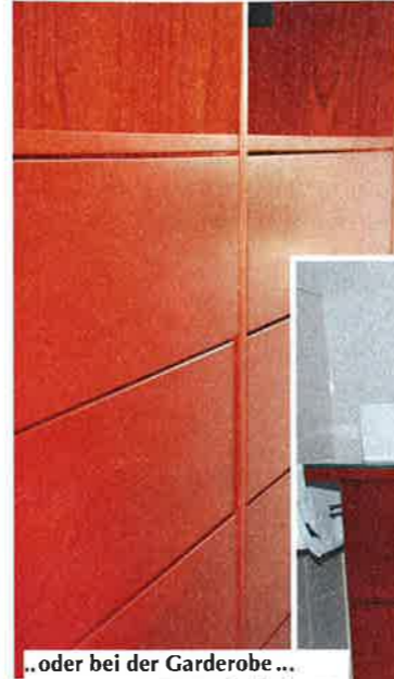
...oder bei der Garderobe ... ...oder im Badezimmer