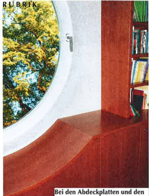
Bei den Abdeckplatten und den formverleimten Einbauteilen, Regalstollen und -böden sowie an den Möbelfronten sind die Kanten mit einer Hohlkehle ausgeführt