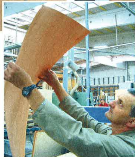
In der Furnierverarbeitung sind ausschließlich erfahrene Mitarbeiter eingesetzt, die über entsprechend handwerkliches Können und Erfahrung verfügen

galstollen und -böden sowie an den Möbelfronten sind auf besonderen Wunsch des Hausherrn die Kanten mit einer Hohlkehle ausgeführt, was die Hochwertigkeit der Einbauten „massiv“ unterstreicht. Auch mit Hinsicht auf eine optisch starke Bildabwicklung, die zudem die Schönheit des Kirschbaumfurniers emotional zum Ausdruck bringt, wurden die messerfurnierten Bahnen handverlesen ausgewählt. Ein nicht ganz einfaches Unterfangen angesichts der erforderlichen Dimensionen bei den Furnierblättern für die breiten Türen. Das Zuschneiden, Verkleben mit Harnstoffleim, Verpressen und Schleifen der furnierten Flächen übernahmen ausschließlich erfahrene Mitarbeiter, die über entsprechend handwerkliches Können und Erfahrung in der Furnierverarbeitung verfügen. Allesamt Spezialisten im Furnierbereich mit der Kompetenz, Furniere für einen Arbeitsauftrag exklusiv zu sortieren und dem individuellen Kundenwunsch entsprechend zusammenzustellen. Wahrhaft meisterhaft auf ganzer Linie – Schreinermeister und Möbelspezialist im Zusammenspiel, die alles daran gesetzt haben, den Wunsch ihres Kunden „zur vollsten Zufriedenheit“ zu erfüllen.