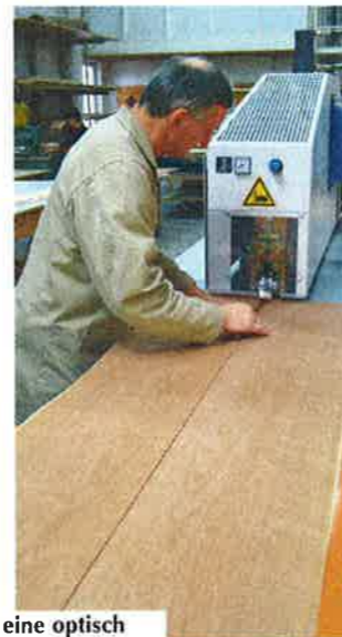
Mit Hinsicht auf eine optisch starke Bildabwicklung wurden die gemesserten Furnierbahnen handverlesen ausgewählt...